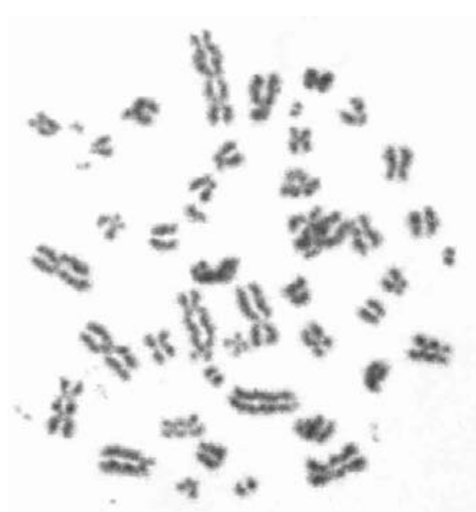
Abbildung 3: Multiaberrante Zelle

an Neutronen und Protonen ausgesetzt ist, und Analysen zum Neutronenanteil in der Hiroshima- und Nagasaki-Strahlung bestärkten ihn in seiner Einschätzung.